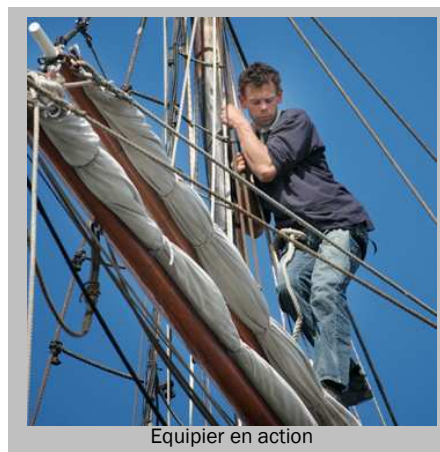
Equipier en action

Animation sur le quai avec des numéros surprises Démonstrations d'artisanat maritime Programme éducatif pour les écoles les 22 et 23 mai