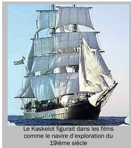
Le Kaskelot figurait dans les films comme le navire d'exploration du 19ième siècle

Le Kaskelot sera donc le navire amiral central durant Oostende à l'Ancre®, amarré devant la place de la Gare.