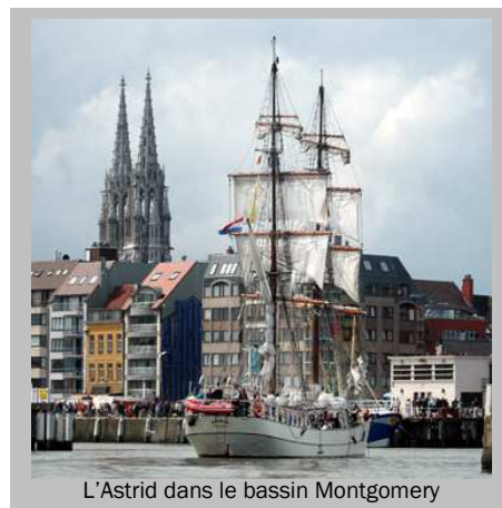
L'Astrid dans le bassin Montgomery

ICOMIA'S 6th International Marina Conférence -25et28 mai, Media Center Oostende // . Croisières à bord de bateaux d'OVA.