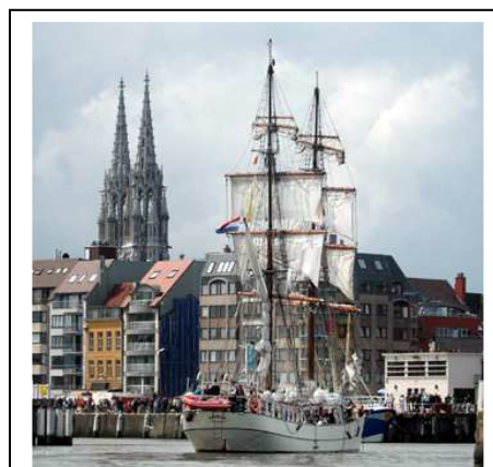
De Astrid in het Montgomerydok

Zeildemonstraties: Zaterdag 24 mei en zondag 25 mei houdt de vloot van zalmshouwen uit Nederland zeildemonstraties. De boten werden vroeger gebruikt voor de visvangst op zalm die vanuit zee tot op de kleine rivieren doorzwom. De Schouwen zijn erg typische bootjes met een vlakke bodem en laten zien hoe hun zijwaarden het varen op windkracht bijstaan. Dit heeft plaats in het Mercatordok tussen 14 uur en 18 uur. In datzelfde weekend wordt ook een demonstratierace gevaren met Mini J Boten . Dit zijn verkleinde zeiljachten waarmee aan de America's Cup werd deelgenomen. De boten zijn net groot genoeg voor 1 persoon die alles moet bedienen. Deze wedstrijden hebben plaats in de voor- en de namiddagen.