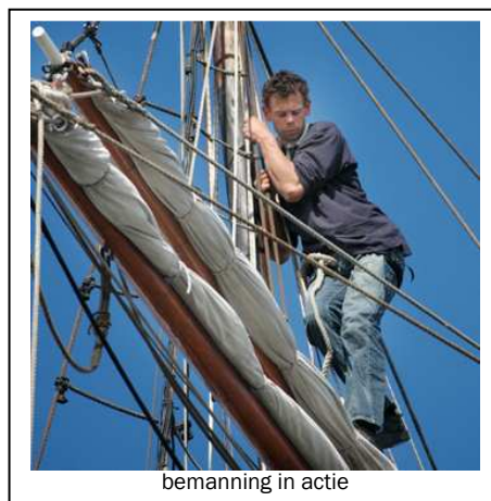
bemanning in actie

Vaar mee met de tweemaster Jantje, Tecla, Nele en Lotos voor een unieke tocht op zee. Reserveer uw plaats aan boord bij de schepen vóór de afvaart.