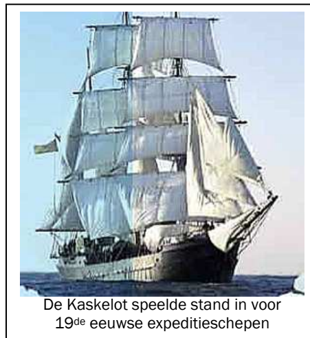
De Kaskelot speelde stand in voor 19 de eeuwse expeditie schepen

De Kaskelot wordt dan ook het centrale vlaggenschip van Oostende voor Anker®, aangemeerd voor het stationsplein.