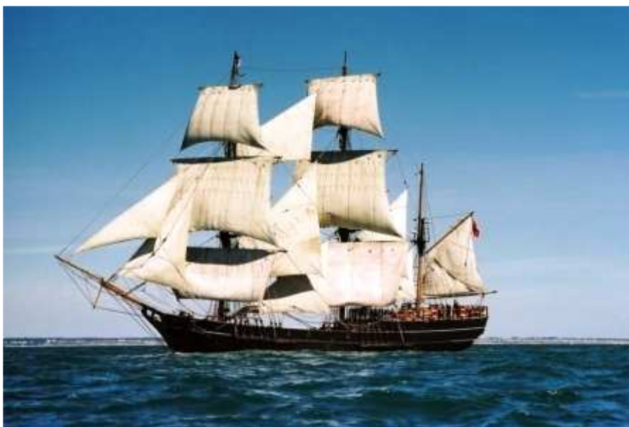
Earl of Pembroke – een van de nieuwe driemasters op Oostende voor Anker